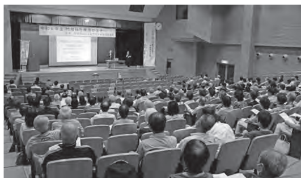
地域福祉推進セミナーの開催