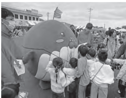
みすみふるさとまつり