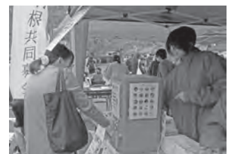
ガチャガチャ募金