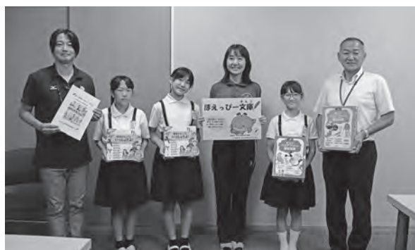
図書を送り出し、子どもたちの福祉の心を育みます。