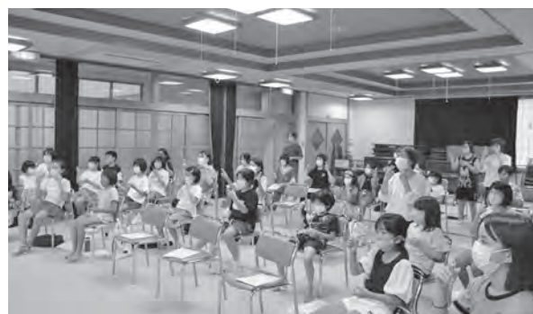
手話教室を開催し、福祉の心を育みます。

どうぞ、地域の皆様のさまざまな声をお寄せいただくと同時に、本会会費にご協力くださいますようお願いいたします。