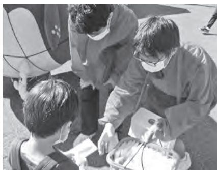
日置ふるさとまつり