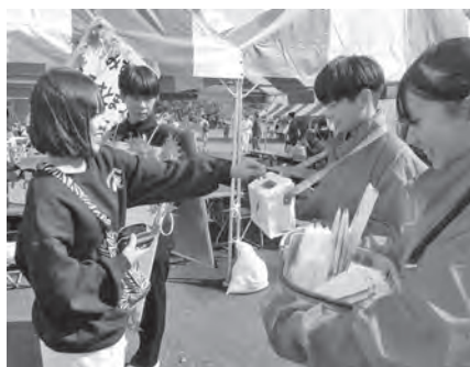
三隅ふるさとまつり