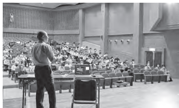
地域福祉推進セミナーの開催