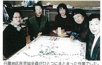
日置地区民児協全員がひとつにまとまった作業でした。

最近気のせいかもしれませんが、なくなった言葉がある。「ごころの時代」「福祉の時代」……ちょっと前はみんなが口にしてたのに。そういえば近頃は経済に明るい兆し……とか。でも福祉が景気と反比例しているとは思いたくないですね。