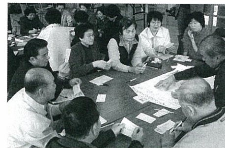
渋木東地区での話し合いの様子