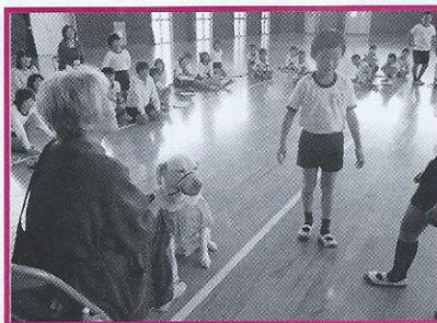
出前体験教室 (仙崎小)