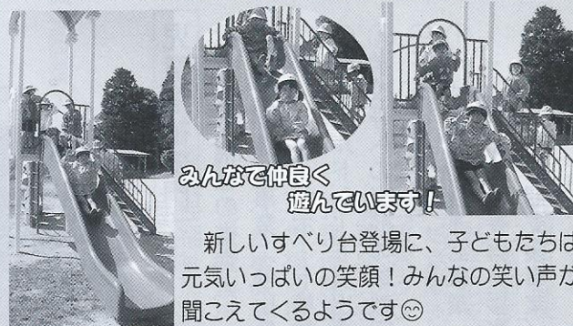
みんなで仲良く遊んでいます！

新しいすべり台登場に、子どもたちは元気いっぱい笑顔！みんなの笑い声が聞こえてくるようです☺