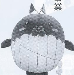
ゆるキャラ「ほえっぴー」