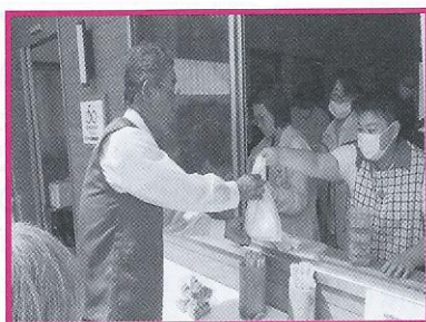
たけのこ村まつり