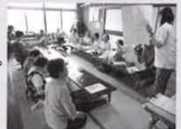
サロン活動の様子 (三隅 豊原さくらサロン)

ふれあい・いきいきサロンは、住民同士で 気軽に集まれる居場所をつくり、地域の「仲間 づくり」「出会いの場づくり」を図る活動です。 みんなで集まって「気軽に」「無理なく」「楽し く」活動し、参加者と地域のボランティア等が 一緒に企画し自主的に運営します。