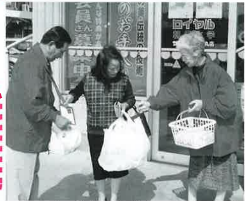
サンマート人丸店