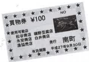
オリジナルの 買い物券

これからも町内の高齢者とのつながりを大切にし、地道に取り組んでいきたいと思ひます。