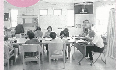
見学・会食を通して交流を図りました。