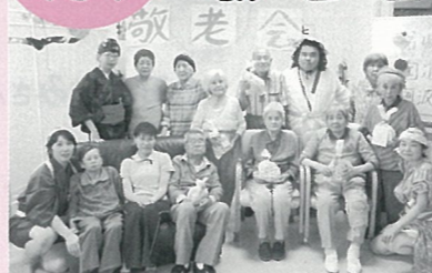
ひだまり劇団と一緒にハイ・チーズ☆