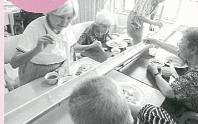
1日中、夏の風物詩を楽しみました。