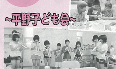
上手な演奏ありがとう! また来てね。