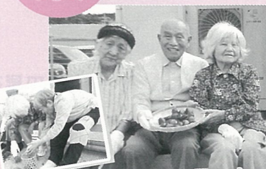
みんなで協力して拾いました!

ご利用の相談、見学の希望等、お気軽にご連絡ください。介護が必要になったら、ぜひご登録を!