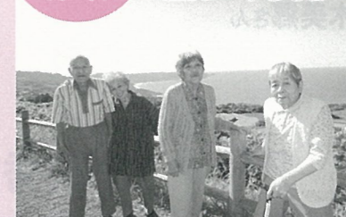
天候に恵まれ、景色も最高!