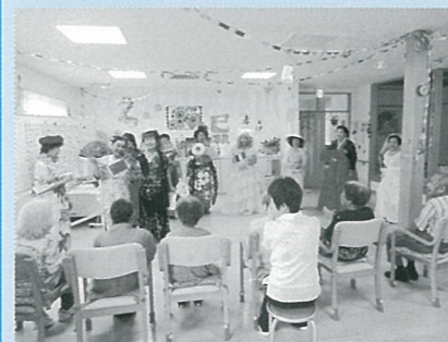
▲ 「夢見る会」メンバーさんによる 歌や踊りで大盛り上がり!