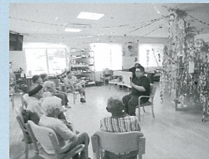
▲ 職員手作り紙芝居