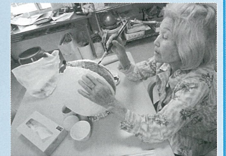
▲ ちょうちん作り 夏祭りの準備をみんなで しました。