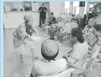
▲ 安来節を職員が披露!!