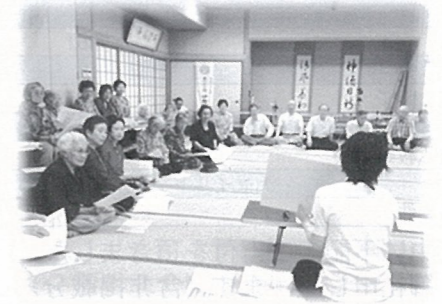
高齢者の集いの様子

藤中自治会では、早くから自治会福祉活動を行っており、自治会役員や民生委員、福祉員の協力体制のもと、毎年6月と11月に開催される『藤中高齢者の集い』は、今年で23年目になります。70歳以上の高齢者が集まり、ちょっとしたためになる講座やゲーム・余興を行った後、待ちにまつた会食会になります。今年6月には40名もの高齢者が集まり交流を図りました。