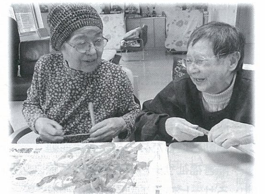
▲楽しい？フキの皮むき。タケノコと一緒に炊いておいしくいただきました。

『ひだまり長門』では、たくさんのボランティアの皆さんに来ていただいています。地域に支えられながら、親しみのある場所をこれからも目指して行きたいと思います。