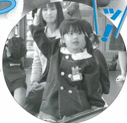
▲きちんとお返事もできました！

今年は男女各2名、合わせて4名の園児が新しく加わり、10名の園児で楽しい園生活を送ることになります。