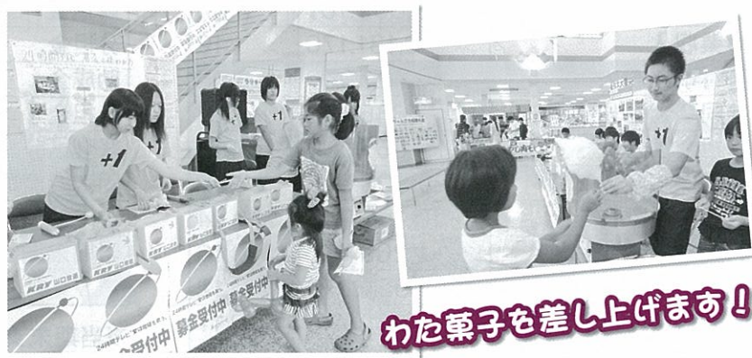
わた菓子を差し上げます!