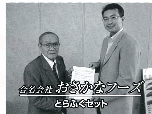
合名会社 おさかなフーズ とらふぐセット

住 所：長門市油谷津黄897 電話番号：32-2003 営業時間：11:30~14:00頃 ※夜は要予約 定 休 日：月曜日 ☆お食事処「汐風」で提供するお料理、お弁当1つ販売につき10円を寄付していただくことになりました。 観光名所「竜宮の潮吹」のすぐ近くにあり、安く新鮮な漁師料理が自慢です。