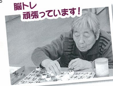
脳トレ頑張っています!