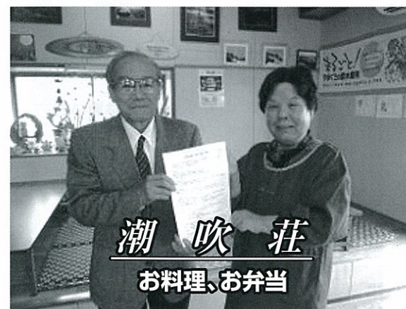
潮 吹 荘 お料理、お弁当

このプロジェクトは4月から県内でスタートし、表紙に掲載したコココーラウエスト(株)の自動販売機もその一環です。長門市では、他に2つの企業からご協力をいただきましたのでご紹介します。