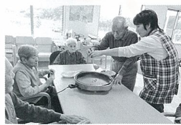
▲おやつ作りの様子

「通い」サービスでは、送迎、入浴、昼食、移動や排泄などの日常生活動作の援助のほか、楽しみながら体を動かせるゲームや個別の脳トレメニュー、手芸、外出行事、野菜作りなどを通じて、利用者さんが持っている力を十分に発揮できるよう少人数の馴染みの関係を生かして、一人ひとりの思いや希望を大切に、のんびり、ゆったりと過ごせるようにプログラムを組んでいます。