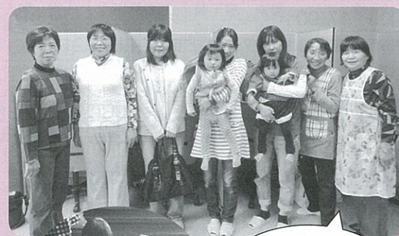
パソコン教室受講生みなさんと♪

託児ボランティアグループ「にこにこ会」です。研修会や会議、各種イベント会場に、たくさんのおもちゃと一緒に出向き、参加者のお子さんをお預かりしています。