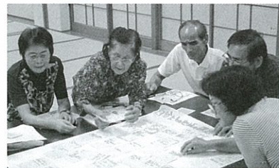
▲地域での話し合いの様子