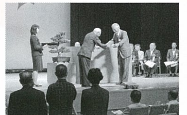
▲平成23年度社会福祉大会