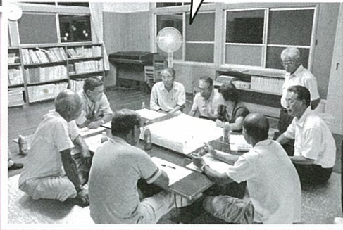
平成23年度 助成実績