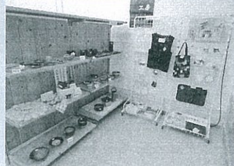
▲棚には、たくさんのステキな作品があります。