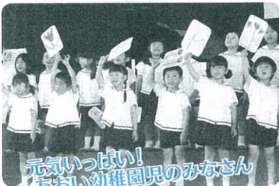
元気いっぱい！ あおい幼稚園児のみなさん