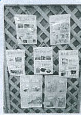
▲収集後の流れもわかります。

センター内では、市内の作業所利用者やサロン参加者等による作品を展示販売しています!また、どなたでも参加できる収集ボランティアのコーナーもあります。エコキャップや古切手などの収集にご協力ください。