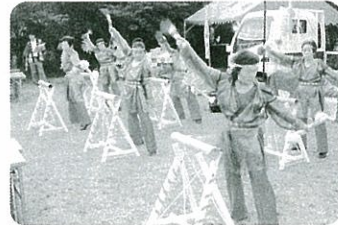
今年の夏は「ふるいち よってけ 夏祭り」に出演

銭太鼓で手を使い、健康とボケ防止につながるようにと活動しています。立ち銭太鼓は動きがハードなので体型もスリムになり、みんなで仲良く和気あいあいとやっています。月2回の活動に加え、施設訪問やチャリティ大会にも参加しています。