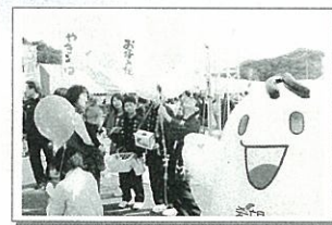
赤い羽根共同募金 イベント募金活動