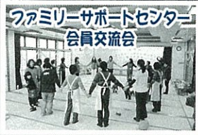
「ファミリーサポートセンター」 会員交流会

事業・行事の紹介は、 社協だより/奇数月発行 ケーブルテレビ (ほっちゃTV) /随時 コミュニティラジオ (FMアーク) /毎週金曜日 18:00~19:00 などで随時ご案内していきます。