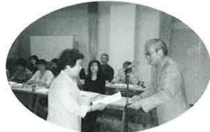
三隅地区福祉員集会にて、委嘱状交付

福祉員さんは、各自治会から選出され、地域のネットワークの要として活躍されています。 本年度は、長門市内412名の福祉員さんが委嘱されました。