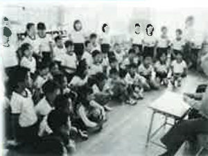
総合学習での福祉教育 (仙崎小)

長門全域での開催(新)事業 ☆男性高齢者料理教室開催 ☆乳幼児すくすく育成事業 ☆安心生活創造事業 (国モデル事業)