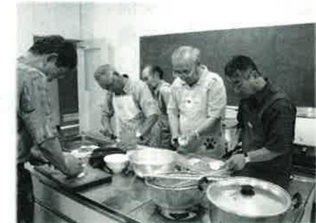
男性高齢者料理教室 (油谷)