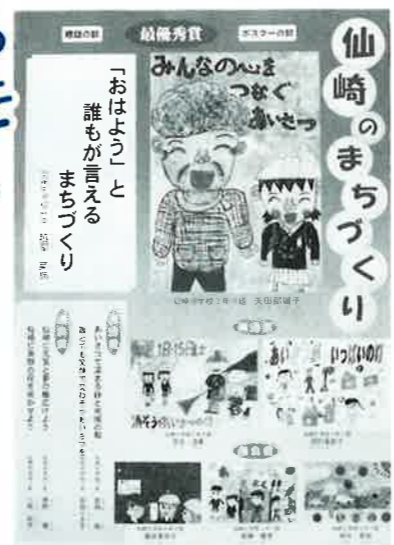
仙崎小学校のみなさんの協力により、ポスター完成！