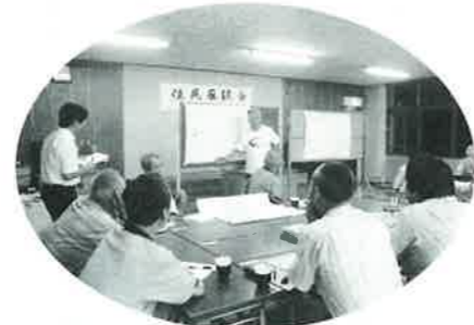
昨年夏に開かれた、仙崎地区、座談会の様子。

昨年の夏、仙崎地区で住民座談会が開催されました。 地域みんなで取り組めることの企画案… 「子どもの登下校に合わせて、家の周りを掃除しながら声をかける」 座談会で考えた案が実現に向けて動き出しました！