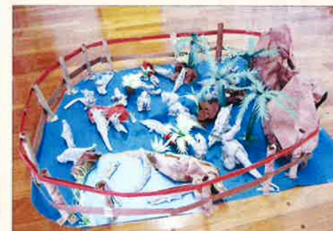
菱海保育園 年長組

みんなで稲を見にいったよ。 稲の花がヒラヒラ降ってきたんだよ。 稲がきみみたいだったね。 花びらをフーツとふいたよ。きれいだったね。