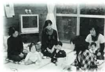
乳幼児への絵本の読み聞かせ (三隅)