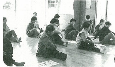
三隅：野波瀬「しらすサロン」