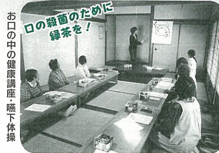
お口の中の健康講座・嚥下体操