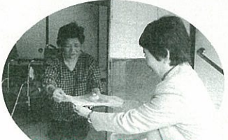
ありがとうございます！いつも助かっています。

私たちは、平成4年より主に三隅地区で活動をしています。牛乳パックで椅子を作ったり、古着などで小物を作ったりし、お祭りなどで販売しています。その収益で、スポーツ少年団、ふれあい・いきいきサロンへの助成も行っています。