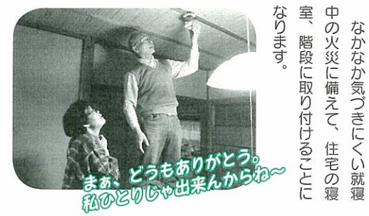
まあ、どうもありがとう。私のひとりじゃ出来んからね～

どんなもの？ 煙を感知する「煙式」と熱を感知する「熱式」がありますが、義務化されたのは「煙式」のみ。煙を感知すると、警報音が鳴ります。 どうして取り付け？ なかなか気づきにくい就寝中の火災に備えて、住宅の寝室、階段に取り付けることとなります。