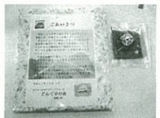
防水シートと手作りの人形