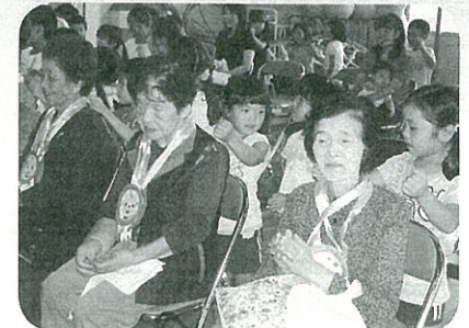
保育園児との交流会