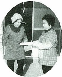
油谷 お誕生日の月にプレゼントを持って訪問。