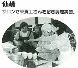
仙崎 サロンで栄養士さんを招き調理実習。