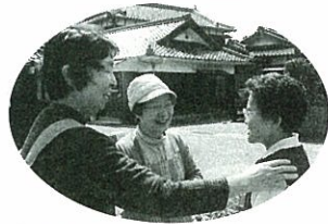
三隅 「健康相談」・・・地域の皆さんに呼びかけ。