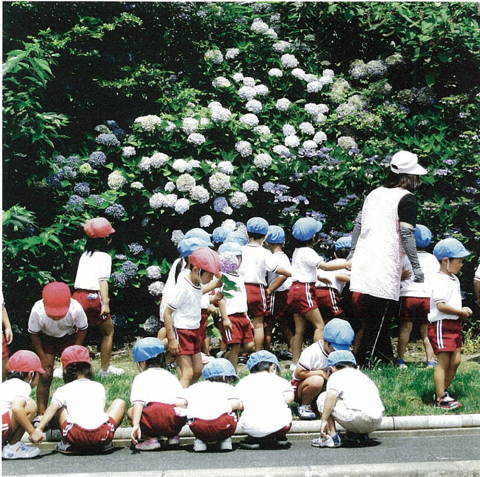
梅雨の晴れ間に…どれが紫陽花、どれが帽子？ (三隅保育園)