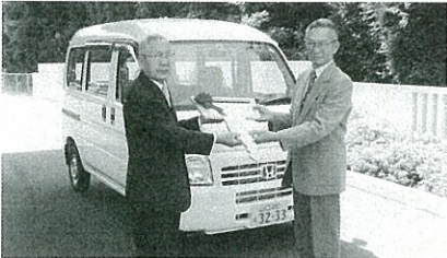
◎ 芝崎 伊村賢治 様より

◆香典返し 111件 4,381,082円 ◆見舞い返し 31件 530,000円 ◆篤志寄付 7件 1,066,376円