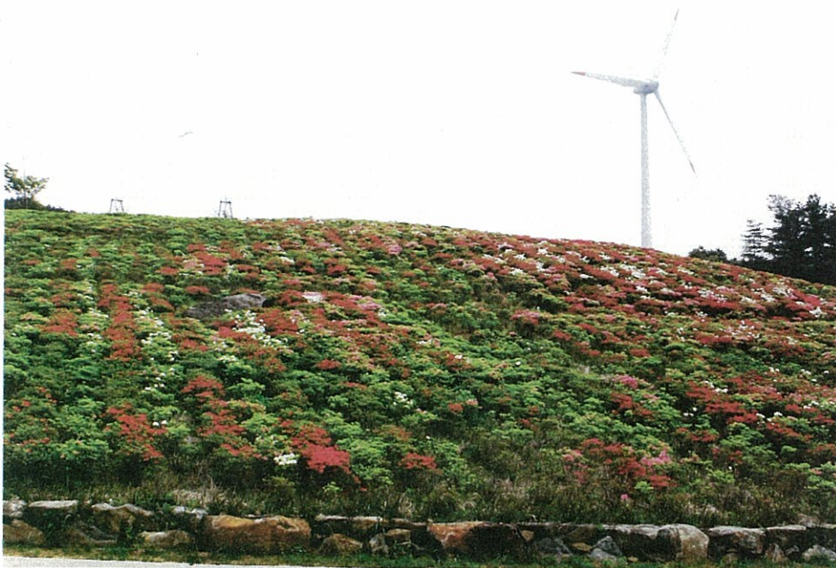
♪ 春から - 初夏への～ 千畳敷 ♪