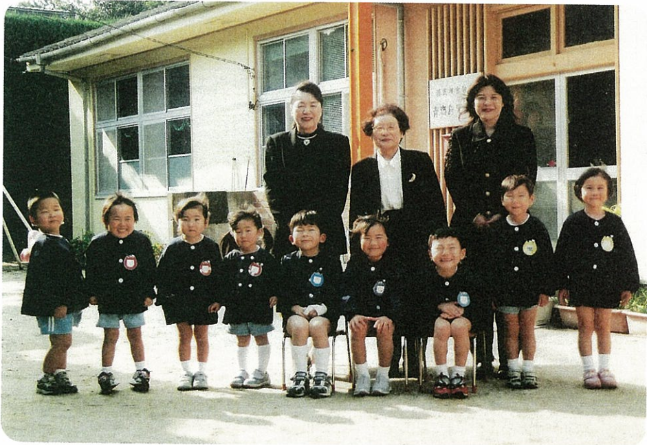
青島児童館…今月で閉館。