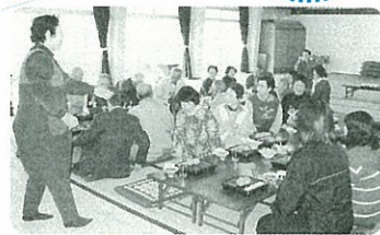
ふれあい昼食会(湯免自治会)