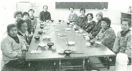
みんなで作って食べると美味しいね