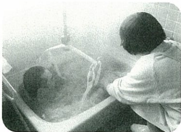
やっぱりお風呂が一番！