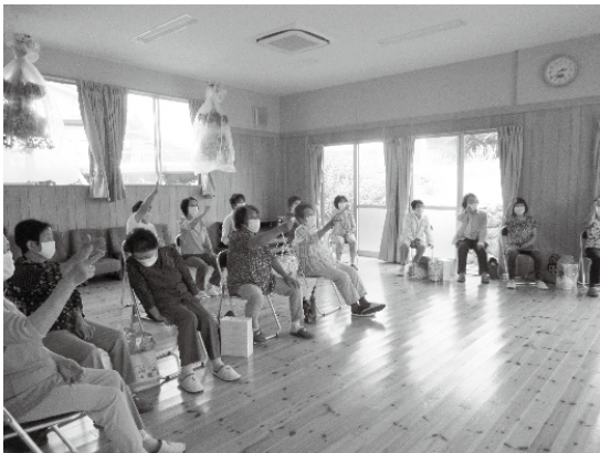
▲間隔を空けて楽しくレクリエーション♪

平成14年に発足し、今年で20年目に入りました。当初は「土手中村いきいきサロン」という名前でしたが、平成18年に「なぎの木いきいきサロン」という素敵な名前に変更しています。