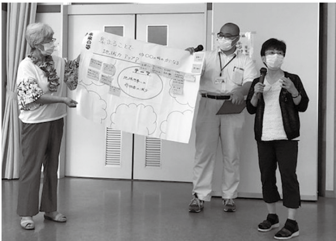
▲ グループ毎の発表の様子。「未来の姿は・・・」