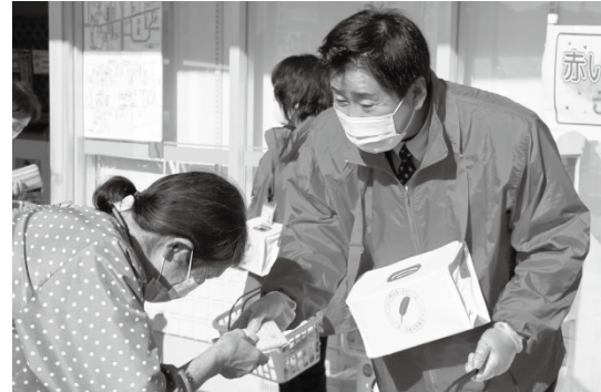
▲ サンマート人丸店