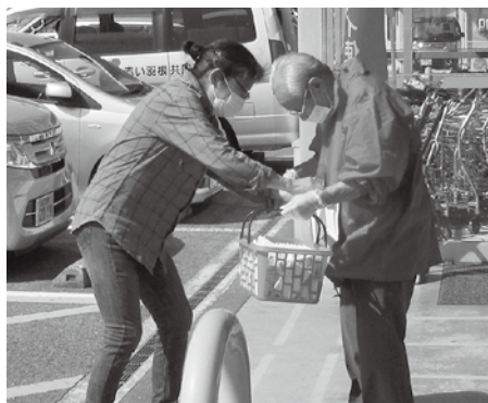
▲ サンマート人丸店

今年も、全国一斉に赤い羽根共同募金活動が始まりました。長門市においては、去る10月2日、Aコープ長門店、サンマート人丸店において、長門市共同募金委員会の皆様のご協力をいただき街頭啓発活動を実施しました。