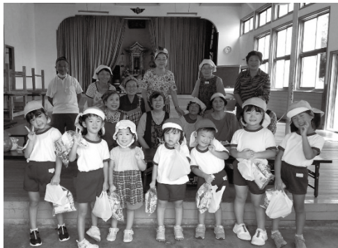
▲宗頭幼稚園園児と合同でお地蔵様祭り

婦人部の解散を機に発足したサロンもようやく3年目に入りました。「今日はやかったよ。楽しかった。」との声に思わずほほ笑みます。