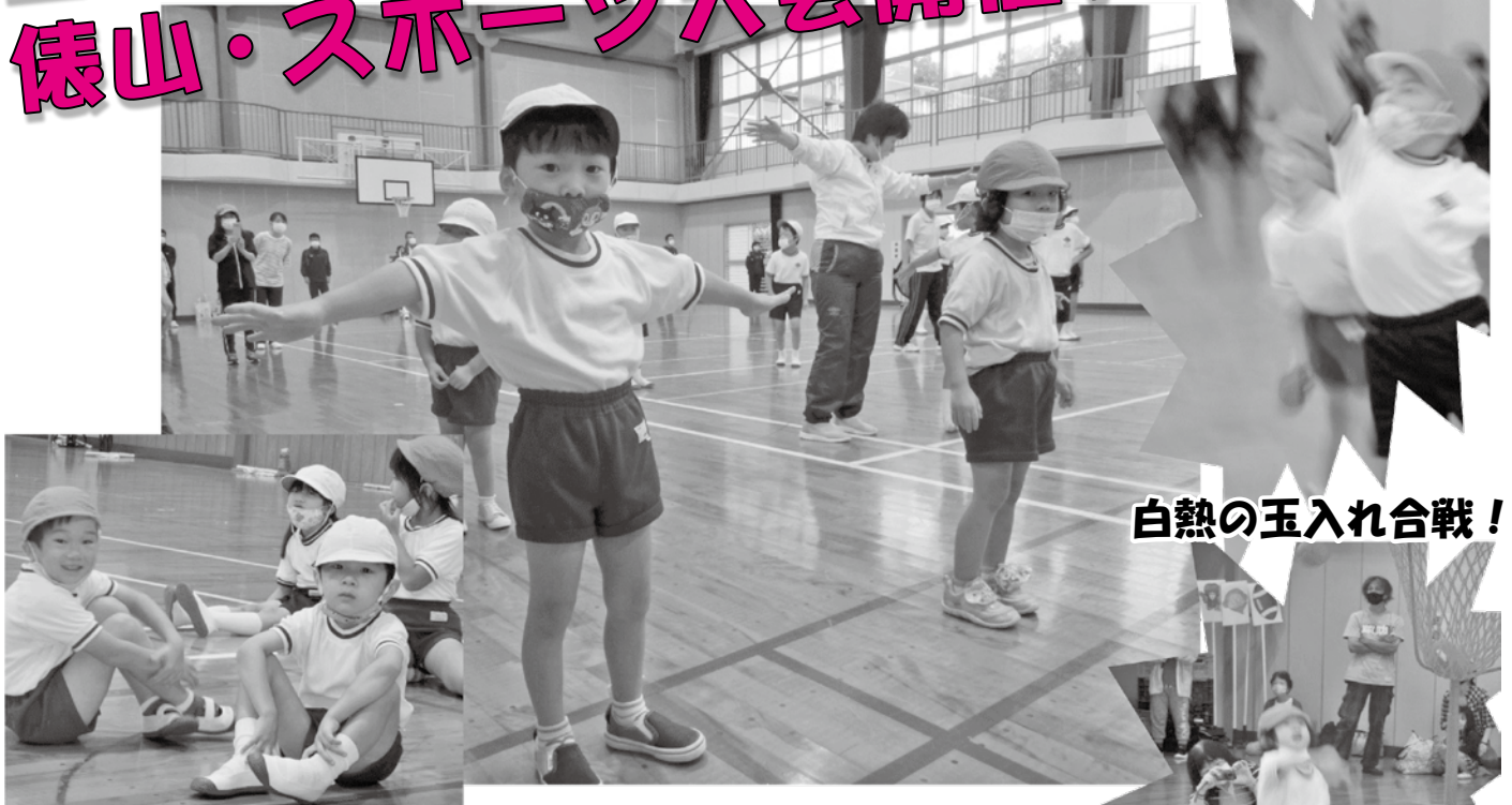
白熱の玉入れ合戦！

9月18日(金)、俵山小学校と俵山幼稚園合同で「みんなで楽しくきずなを深めるスポーツ大会」が開催されました。この行事は、新型コロナウイルス流行の影響で運動会に変わる行事として実施されましたが、参加した子どもたちも一生懸命に取り組み、楽しい大会となりました。