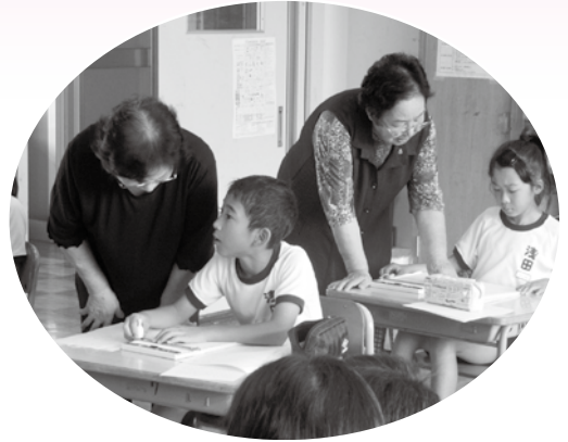
浅田小学校4年生 点字学習