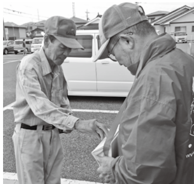
▲ サンマート人丸店

全国一斉に赤い羽根共同募金活動が始まりました。去る 10 月 2 日・3 日に市内 3 店舗（フジ長門店、A コープ長門店、サンマート人丸店）において、長門市共同募金委員会の委員による街頭啓発活動を実施しました。