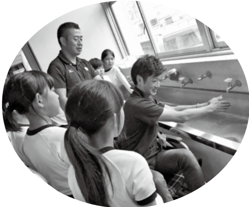
仙崎小学校4年生 車いす体験