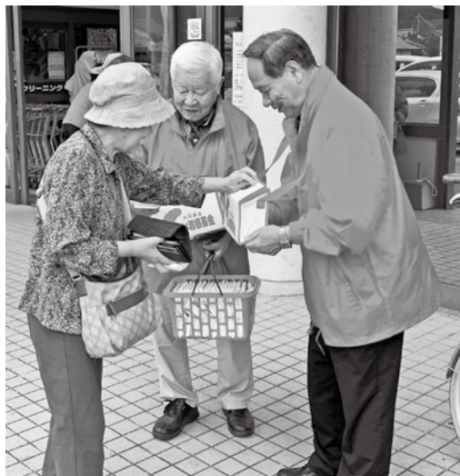
▲ A コープ長門店