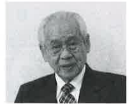
長門市社会福祉協議会