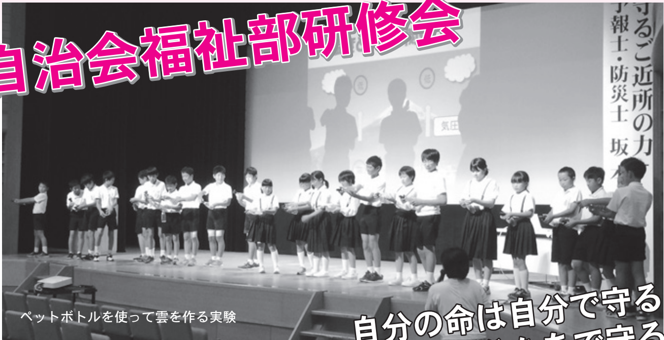
ペットボトルを使って雲を作る実験