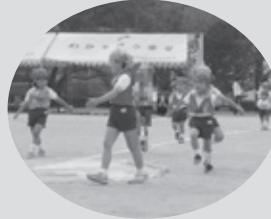
とっても楽しかったよ😊

今年も高校生・一般ボランティアの皆さんにご協力いただき、ウェブにて募金活動を行いました。 集まった募金は、経費を一切差し引くことなく、すべて被災地支援、全国各地の福祉・環境保護支援に活用されます。