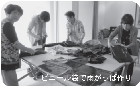
ビニール袋で雨がっぱ作り

9月1日(金)、ラポールゆやにて、「平成29年度 自治会福祉部研修会」を開催しました。テーマは「防災」。大ホール内で防災について講演会が行われたほか、ロビーでは防災に役立つさまざまなイベントが行われました。