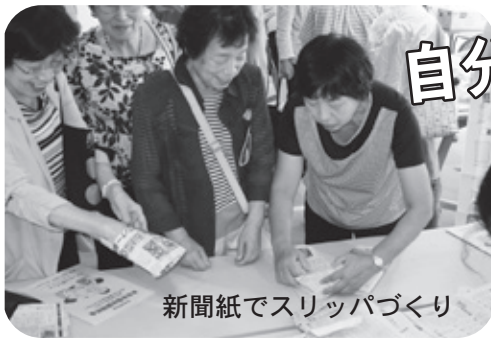
新聞紙でスリッパづくり