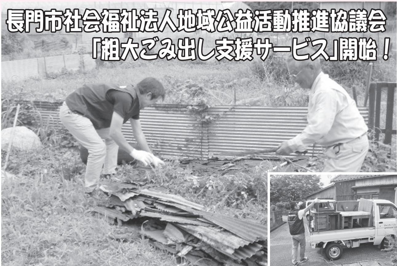
↑活動に取り組む担当法人職員と民生委員の方

市内の社会福祉法人が連携して公益的な活動を推進する目的で発足した“長門市社会福祉法人地域公益活動推進協議会”の「粗大ごみ出し支援サービス」が始まりました。