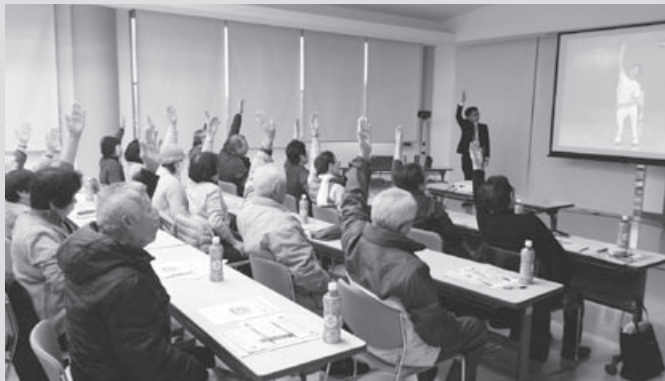
▲ 2月22日（水）油谷地区サロンリーダー研修会の様子