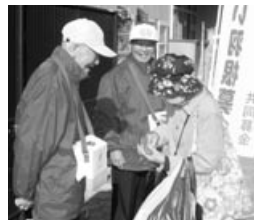
歳末たすけあい募金 啓発活動の様子