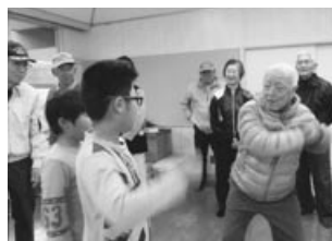
古市自治会福祉部 三代交流会の様子