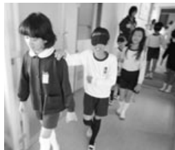
浅田小学校 アイマスク体験の様子