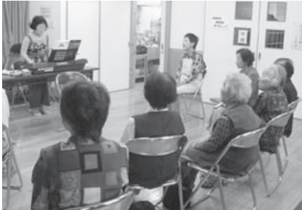
▲ にこにこサロンの様子

古市自治会福祉部では、毎月第2火曜日に「古市にこにこサロン」を開催、自治会敬老会のお手伝い、ひとり暮らし高齢者等の日々の見守りなどを行っています。また、毎年秋に「三世代グランドゴルフ大会」を開催しています。小学1年生から91歳のご長老まで、和気あいあい楽しく競技しています。