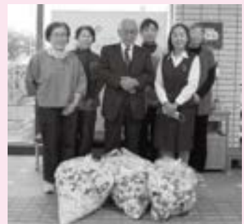
ながと大津商工会女性部様