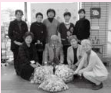
国際ソロプチミスト長門様

ポリオワクチン：1人分 20円（世界の子どもにワクチンを日本委員会公式 HP 参照） で換算した場合、約 4,859 人分!!