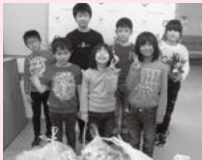
神田小学校放課後子ども教室様