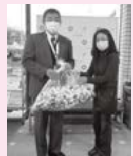
ガールスカウト 山口第9団様