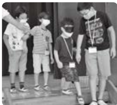
↑わくわく土曜塾(アイマスク・手話体験)