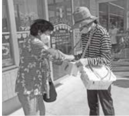
▲ サンマート人丸店